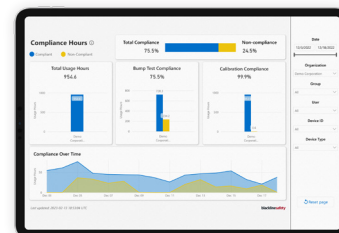
Piattaforma di reportistica di Blackline Analytics