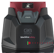
Spia a LED verde