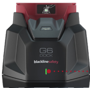
Voyant DEL vert